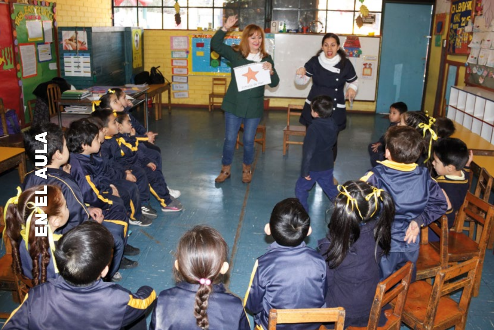
Foto: Escuela Santa Rita de Casia, en La Pintana.