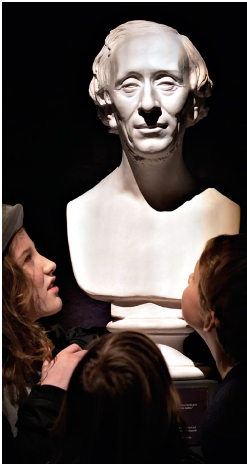
Gentileza: Odense Bys Museer.