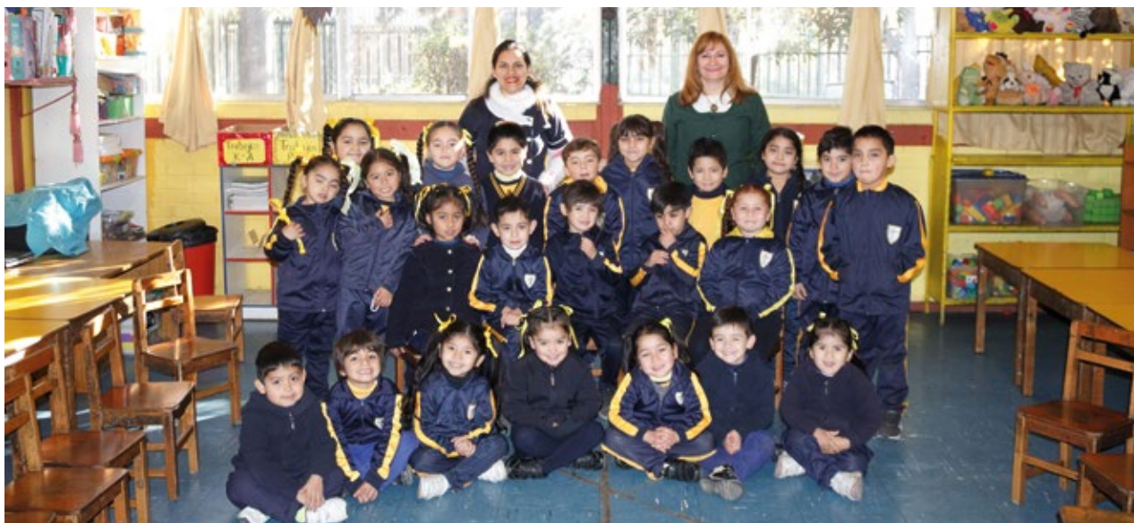
Foto: Escuela Santa Rita de Casia, en La Pintana.